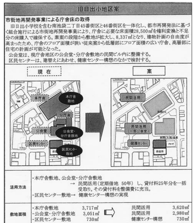
下：新庁舎整備後の現庁舎付近周辺の活用方法