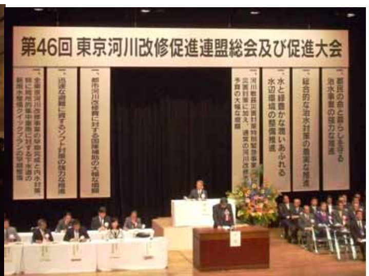
平成20年5月20日 [東京河川改修促進大会に区代表で参加]