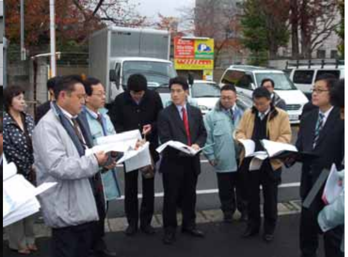
平成19年11月30日 [都市計画道路補助173号線の視察]