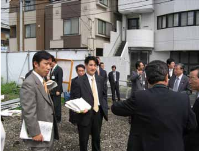
平成19年10月2日 [(仮称)高松1丁目計画の視察]

・常任委員会では都市整備委員会に所属しております。その活動の一端を写真等でご紹介します。